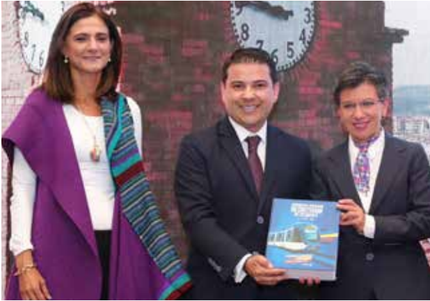
Presentación Regiotram de Occidente. De izq. a der. Ángela María Orozco, Ministra de Transporte; Nicolás García, Gobernador de Cundinamarca y Claudia López, Alcaldesa Mayor de Bogotá.